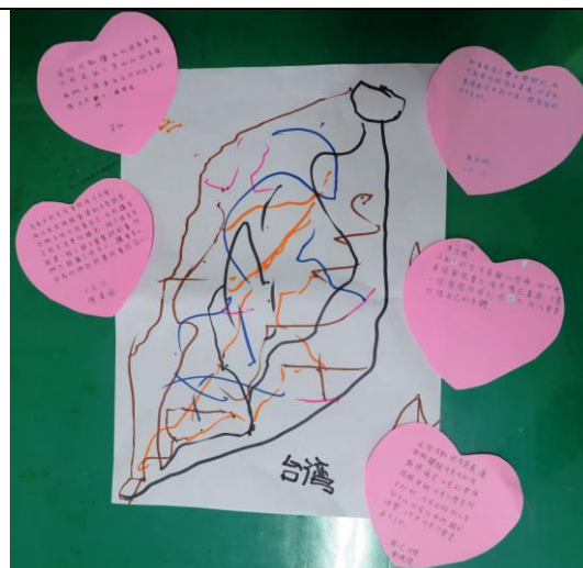
看看小組作品與心得-台灣