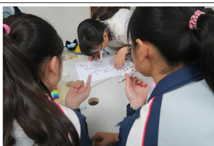
創作作品是由同組學生接力完成。