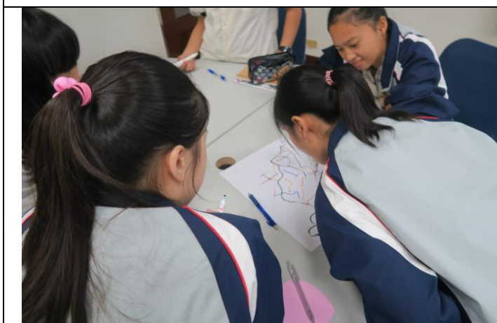
手怎麼要都不可以握住筆。口水直流出來！