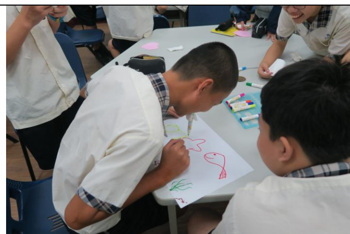
沒手的創作好辛苦。