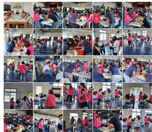
會場到處可見志工媽媽身影