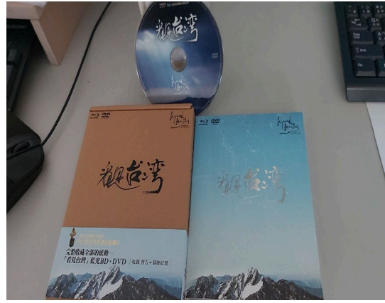
觀賞影片-看見台灣