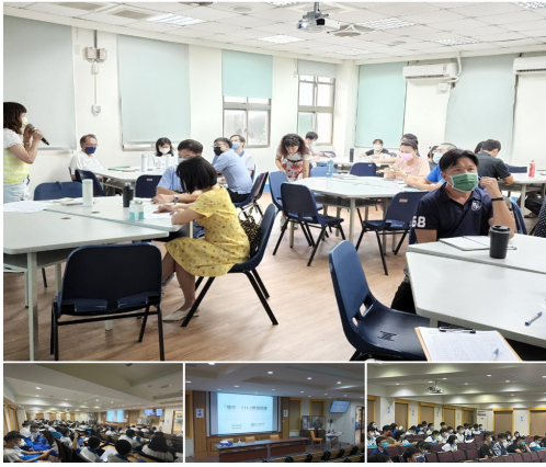
活動前導師及幹部宣導活動