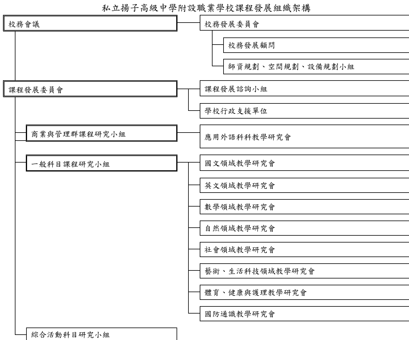
圖 1 課程發展組織架構圖